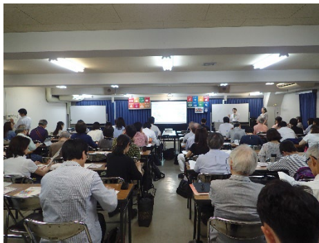
G20 大阪市民サミット分科会の様子